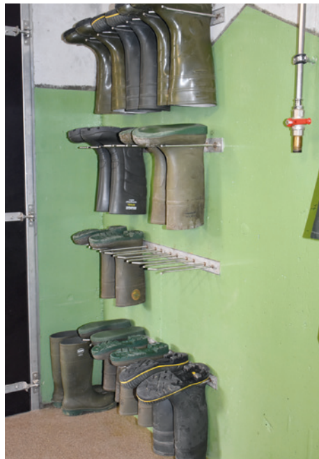
Illustr. 1: Idéal - des bottes disponibles en plusieurs grandeurs

Un dispositif de nettoyage des mains et de lavage des bottes doit être disponible.