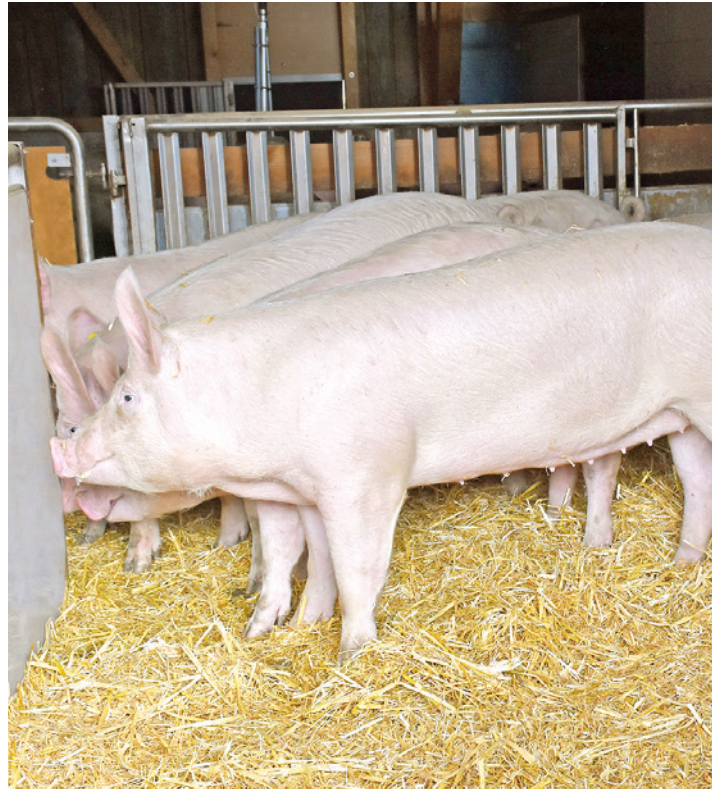
Illustr. 4: Elevage de jeunes truies sain